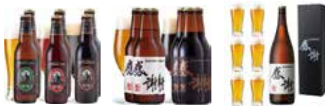
金賞ビール 3種6本セット