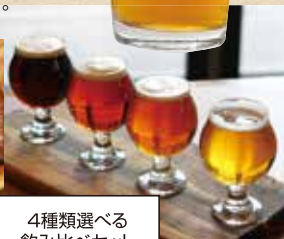
4種類選べる 飲み比べセット