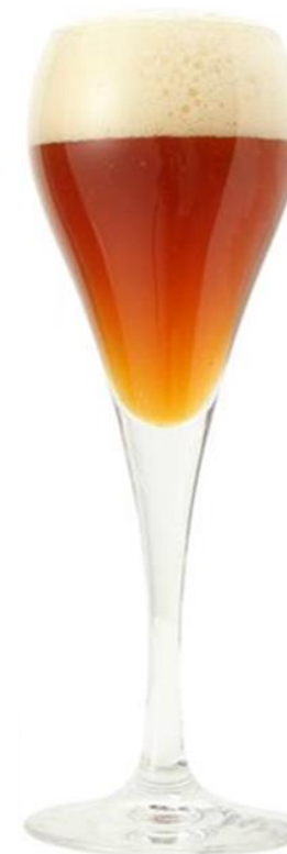
※ラベルデザインは毎年変わります